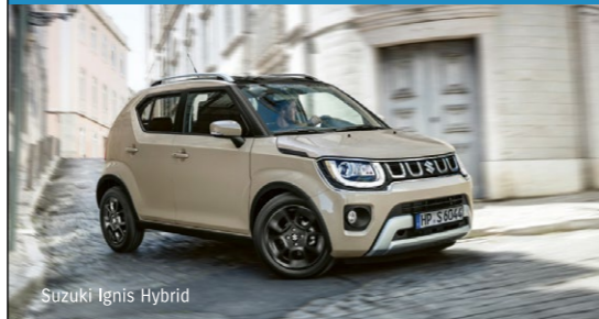
Suzuki Ignis Hybrid

Abbildung zeigt aufpreispflichtige Sonderausstattung.